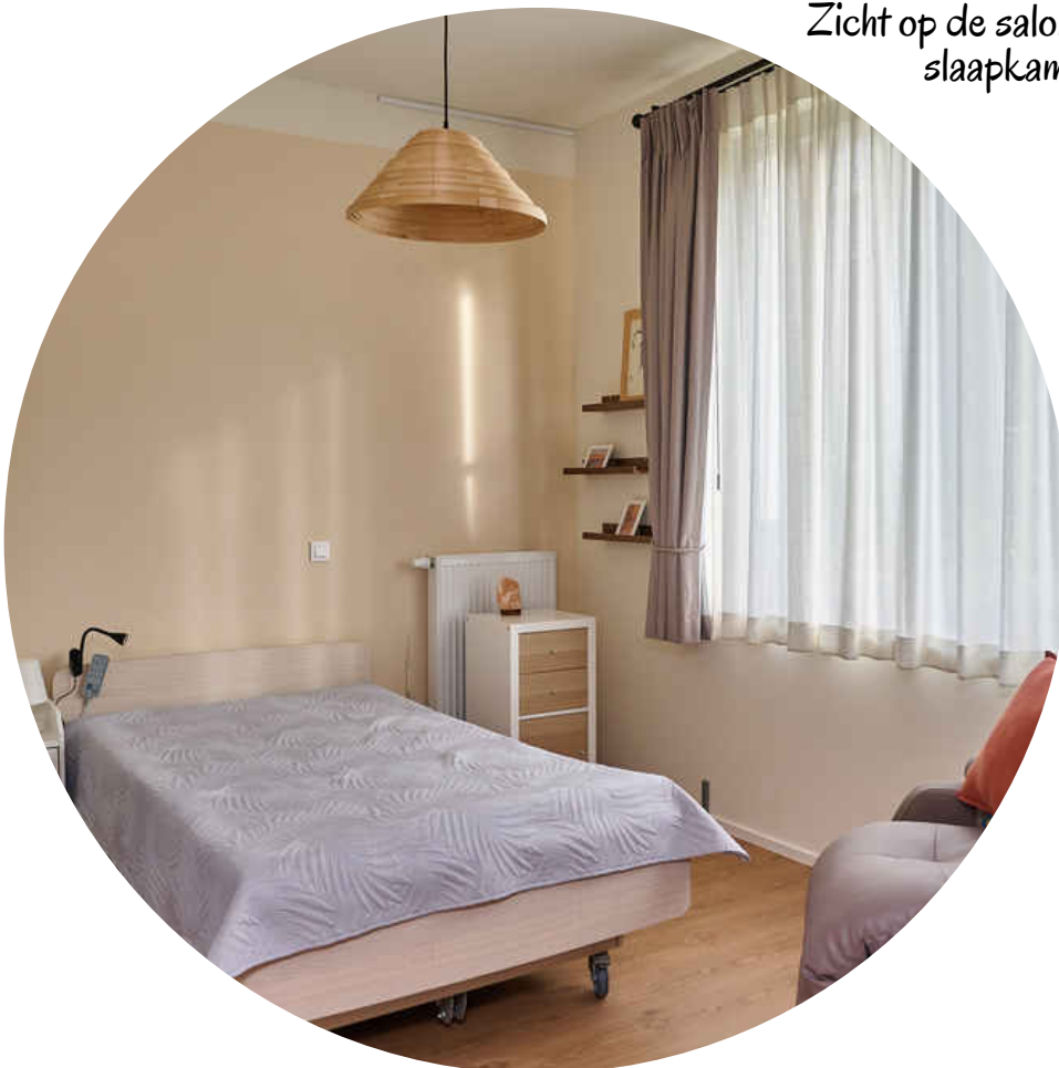
Slaapkamer met comfortabel verpleegbed