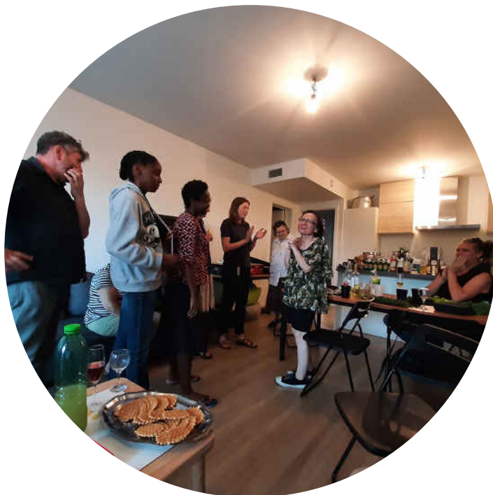
Verjaardagsfeest van een gast - 2022