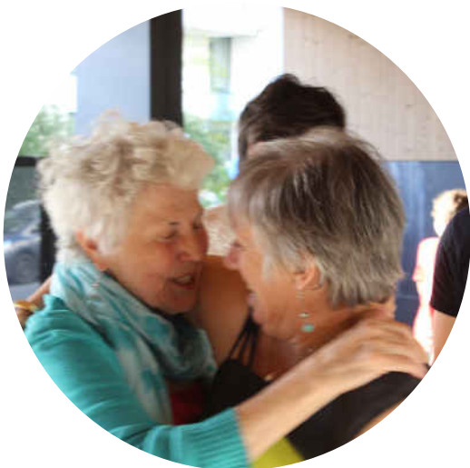
Twee vrijwilligers bij de inauguratie van Pass-ages – 2022