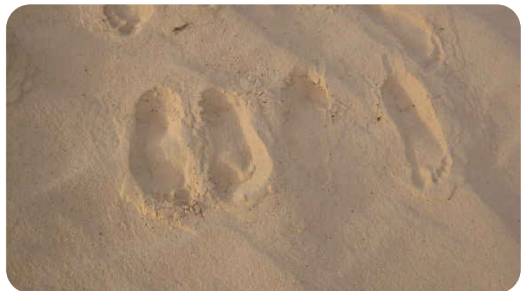
Evocatie van passages en rite

Pass-ages zal beschikbaar zijn om families die dat wensen te helpen bij de voorbereiding van een afscheidsceremonie.