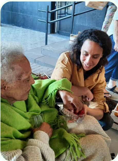
Een gast die de markt bezoekt met een vrijwilliger

In het huis voor levenseinde worden ontvangst en begeleiding afgestemd op het tempo, de behoeften en de eigenheid van de persoon aan het einde van zijn leven en van zijn omgeving.