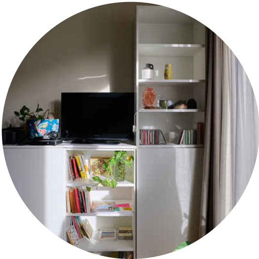
Salon - TV-meubel en boekenkast