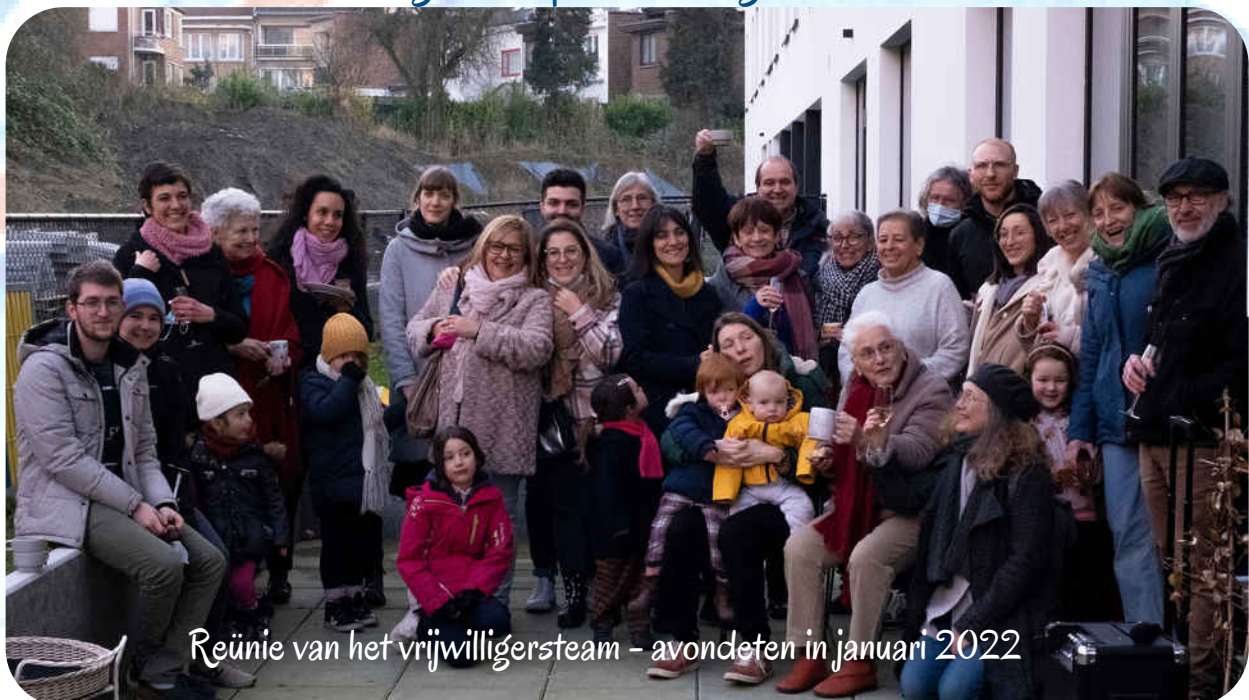
Reünie van het vrijwilligersteam - avondeten in januari 2022

De intergenerationele woongroep biedt alleenstaanden en gezinnen die achter het project staan, een levensvorm gericht op het verzorgen van anderen.