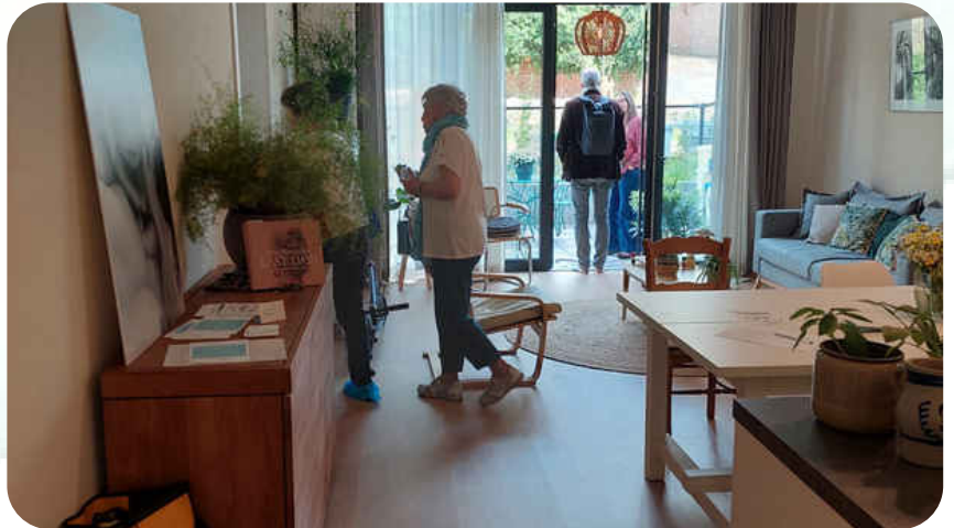
Huiskamer van het huis voor levenseinde met toegang tot de tuin - 2022

Hij/zij wordt er als zodanig verwelkomd en begeleid evenals zijn/haar naasten