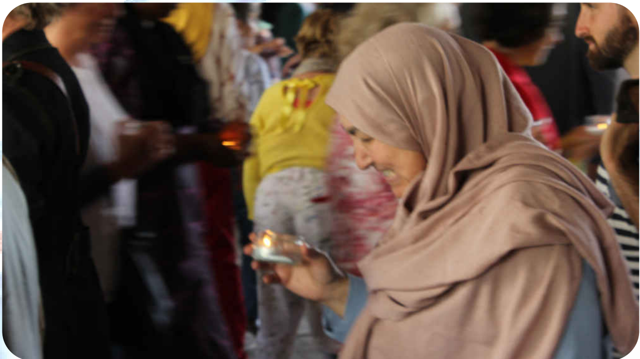
Rite bij de inauguratie van Pass-ages – 8 mei 2022

De hoogte van de bijdrage wordt vooraf afgesproken.