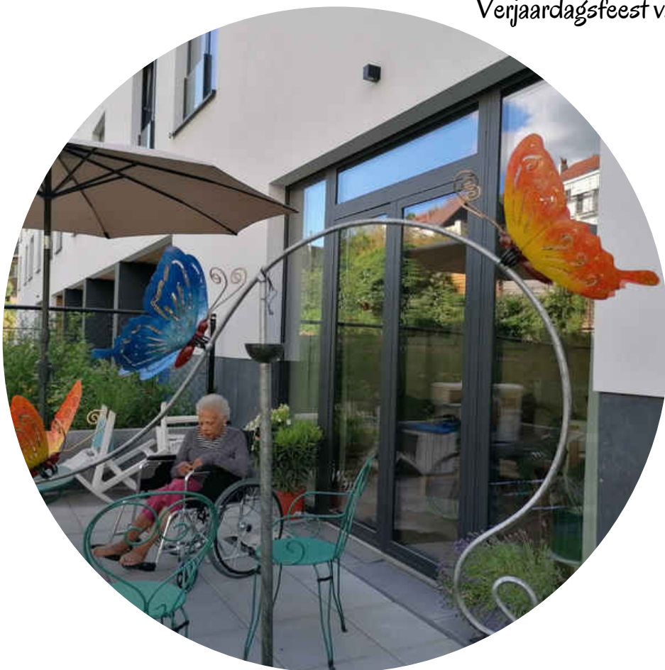
Een lentedag in de tuin – 2022